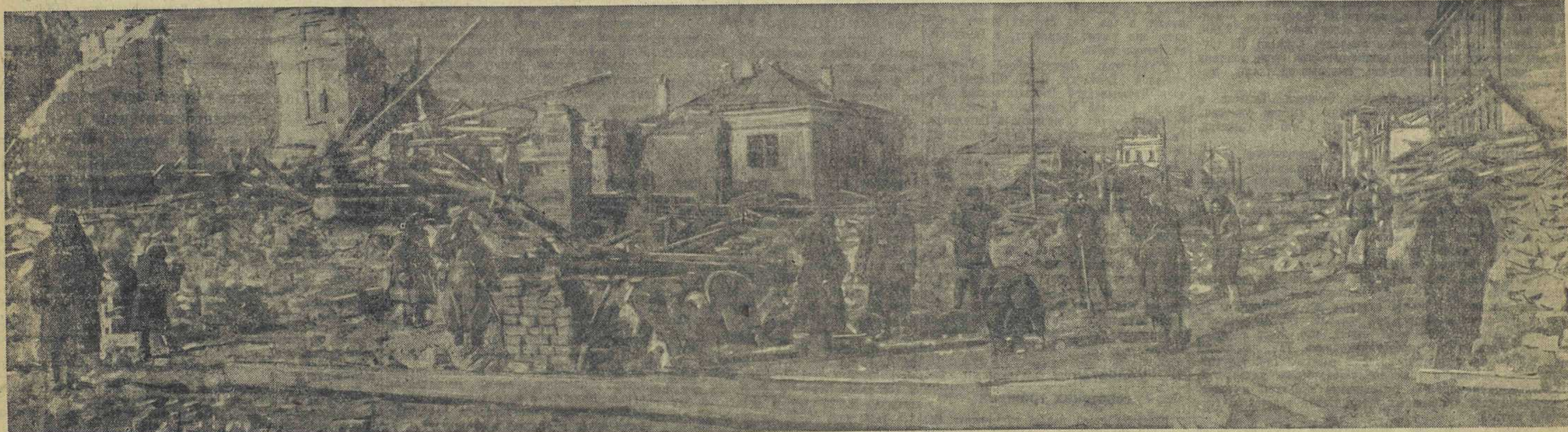
Одна из улиц города Гжатска, разрушенного немецко-фашистскими захватчиками.

командующего 4-й германской армией генерал-полковника Хейнрица и командиров 7, 35, 98, 252, 268 пехотных дивизий и жандармского корпуса, входящих в эту армию: генерал-майора Ропперт, генерал-майора Меркер, генерал-майора Гаррис, генерал-майора Шефера, генерала Грейнера, командира жандармского корпуса генерала Шимана; командующего 9-й германской армией генерал-полковника Моель, командира 27 армейского корпуса генерал-майора Вейс, командиров 6, 72, 84, 102, 129, 337 пехотных дивизий, входивших в эту армию: генерал-лейтенанта Гросман, генерал-майора Мюллер, генерал-лейтенанта Штуглиц, генерал-майора Фишера, генерал-майора Браун, генерал-майора Шонеман, генерал-майора Эвердин; бургомистра города Вязьмы Арнольда Штампа, начальника гестапо барона Айдера; команданта города Сычевки обер-лейтенанта Кислера, начальника лагерей для военнопленных, старших унтер-офицеров Фокс и Раутенберг; военного команданта города Ржева майора Куртфельд, команданта города Гжатска обер-лейтенанта Лейман. Они должны понести суровую ответственность и заслуженное наказание за все их неслыханные злодеяния и преступления, совершенные против народов СССР.